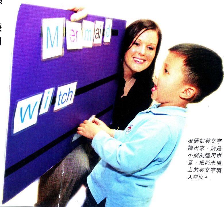
老師把英文字讀出來，於是小朋友運用拼音，把尚未填上的英文字填入空位。