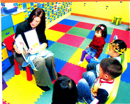
藉著有趣的故事，引起小朋友對閱讀的興趣。

每位小朋友一份工作紙，紙上有一些不完整的英文字，這些英文字與剛才的故事內容有關的，小朋友便會憑着他們剛才所學的知識，將適當的英文字母貼在工作紙的空位上，使成為完整的英文字。