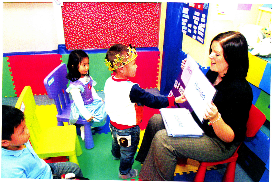
老師利用閃卡來教授小朋友英文生字，看小朋友多投入。

閃卡比賽： 外籍老師事先準備一些與這堂故事內容有關的閃卡，然後先以很快的速度教授小朋友認識閃卡上的英文生字，當小朋友認識那些字後，老師便與小朋友一起進行比賽。老師將所有閃卡鋪在地上，然後小朋友圍着閃卡行走，當老師叫停時，所有小朋友便停下來，老師隨即喊出一位小朋友的名字及一個英文生字，小朋友便要將手上預先拿着的豆袋拋在正確的閃卡上。這樣既考小朋友反應及服