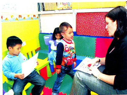
老師與小朋友進行複習，藉以鞏固他們的知識。

投入故事世界： 老師準備了一些戲服讓小朋友輪流穿上，扮演故事中的人物，老師再次向扮演故事人物的小朋友發問問題，了解他們對故事內容的認識，加強他們的記憶能力，並鞏固他們所學的知識。