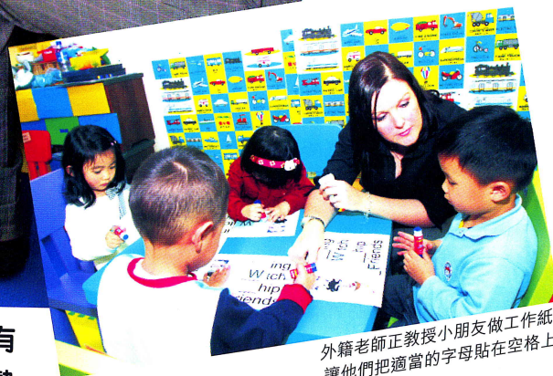
外籍老師正教授小朋友做工作紙，讓他們把適當的字母貼在空格上。

古語有云：「書中自有黃金屋，書中自有顏如玉」。不過，時下香港人對於閱讀並不熱忱，要他們拿起書本閱讀猶如挑起千斤重擔，希望小朋友擁有豐富的知識和英語能力，家長應該從培養他們閱讀習慣着手，使他們愛上閱讀，齊齊做條小書蟲。