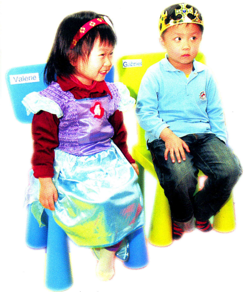
小朋友這身打扮，正是扮演故事中的美人魚及王子的角色，是否很有趣？

程後，除了提高了他們對閱讀的興趣外，更能增加他們的思考能力、創作能力、聆聽能力及會話能力，並能考他們的反應及認識更多不同的英文生字，同時增加他們的自信心，勇於以英語與別人溝通，即使是面對外籍老師，他們也能對答如流，不會產生抗拒。